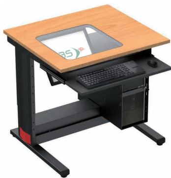
F87SCT + FWB