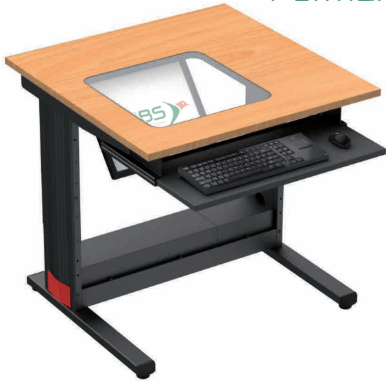
TABLE POUR ÉCRAN ENCASTRÉ SOUS UNE DALLE DE VERRE

Le plan de travail est entièrement dégagé pour y disposer les documents. Fixé sous le plateau sur une platine métallique VESA inclinée, l'écran, de largeur maximum de 480 mm, est visible sous une dalle en verre trempé de 5 mm d'épaisseur affleurant le plateau.