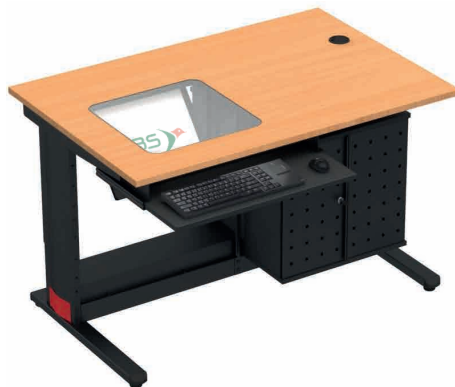
F128SCT + FHHP